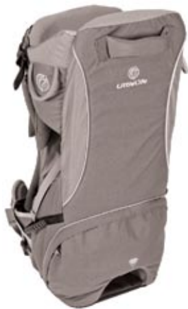
Traveller S2 Child Carrier (L10540) Complies to EN 13209-1:2004